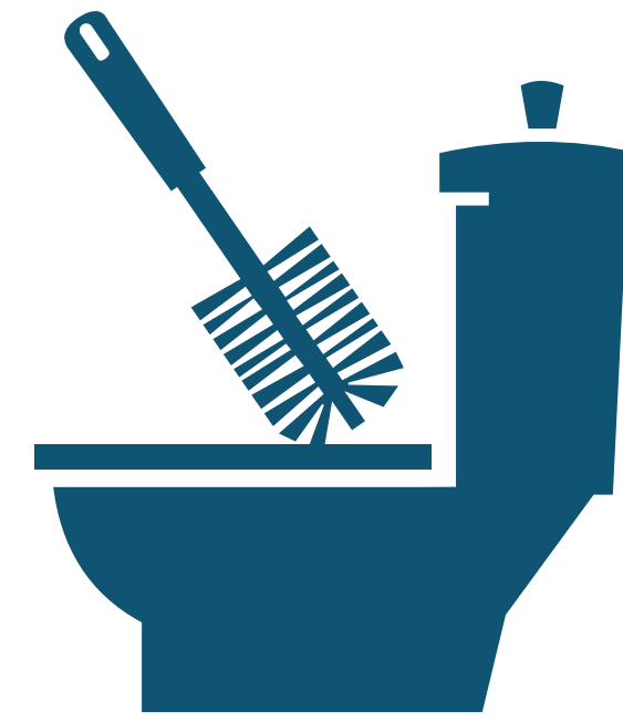
Clean With Brush Limpiar con cepillo