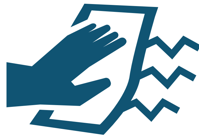
Wipe / Dry Secar con trapo