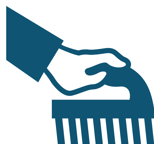
Brush / Scrub Cepillo / Fregue