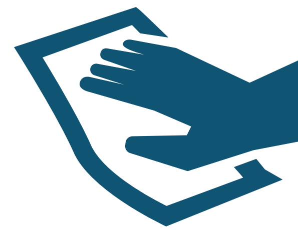
Wipe / Clean Limpiar con trapo