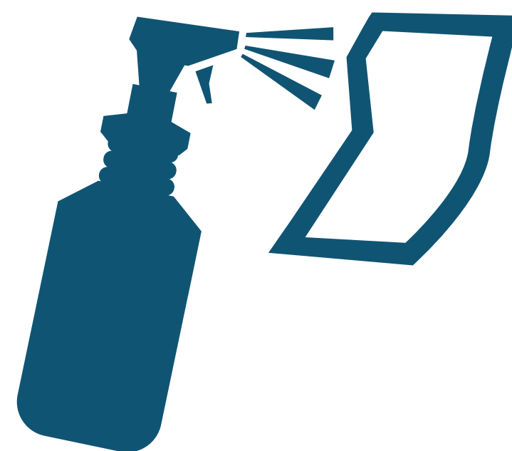
Spray On Cloth Rociar en un trapo