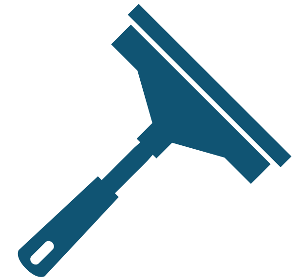
Squeegee Espátula limpiacristales