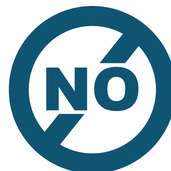
Do Not Use No usar