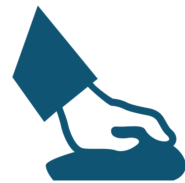
Blot / Rub Restregar / Frotar