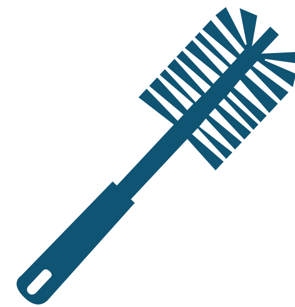
Toilet Brush Cepillo limpiainodoro