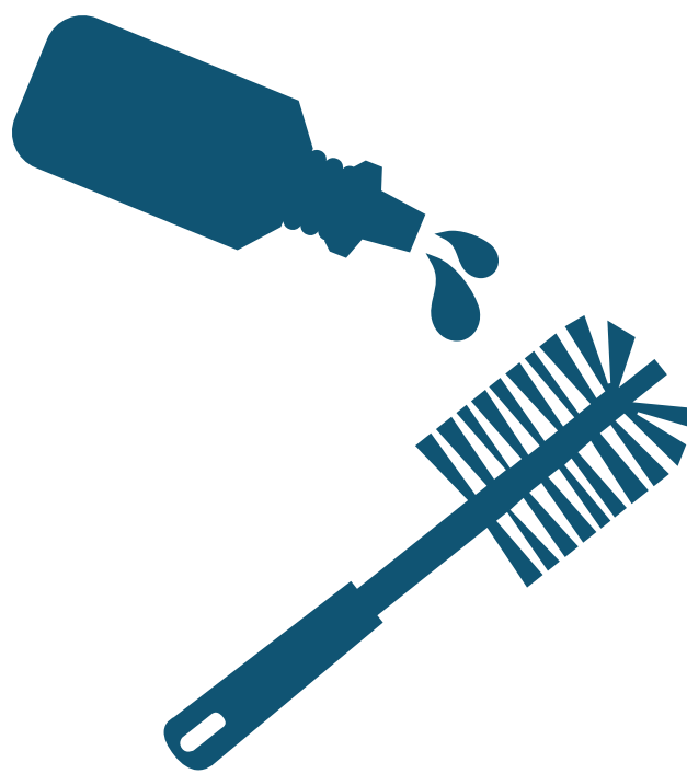
Apply To Bowl Mop Aplicar al cepillo del inodoro